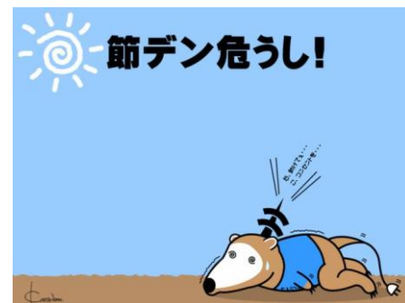
ウォールペーパー