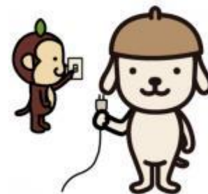
モットちゃん・キットちゃん(大阪府)