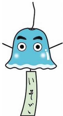
エコジ君(横浜市磯子区)