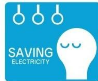
電車で見る節電キャラ (東京都)